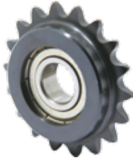
DSSHA DSSHC 带轮毂型