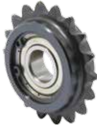
DSS DSSC 单轴承