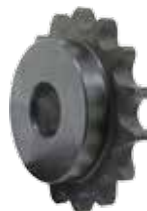
双节距滚子链链轮S型